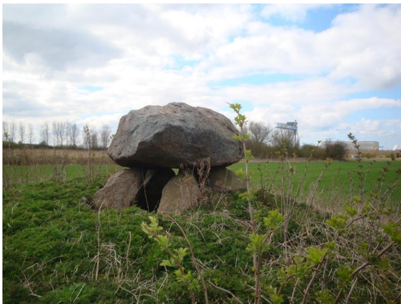
Den smukke runddysse "Lindely Vest"

Man er ret uenige om både dyssernes helt præcise funktion og om de var dækket af jord eller fritstående. Meget tyder dog på det sidstnævnte. Dysserne afløstes som begravelsespladser af de overdækkede jættestuer, som var større og mere indviklede anlæg i sten, gemt i jordhøje. At tumle disse enorme sten, som efter istiden af morænen lå spredt i landskabet, har krævet en enorm kollektiv indsats. Så de kan opfattes som monumenter over de første bønders fælles indsats.