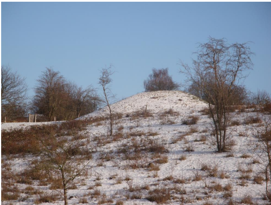
Bronzealderhøjen på Dalbys Høj

Bronzealderens høje (fra ca. 1800 til ca. 500 f. K.) ligner jættestuer, men falder lidt uden for begrebet storstensgrave. De er som regel let genkendelige, da de ligger højt i landskabet, fordi de skulle kunne ses.