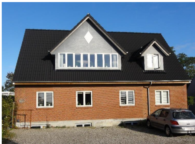
Fjordvej 94, 2013.

Den nuværende ejer købte ejendommen i 1988, og den er i dag ramme om en privat dagpleje.