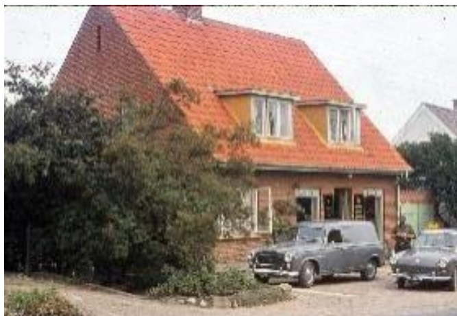
Aabjergs købmandsforretning, ca. 1960

Han er meget aktiv i det lokale foreningsliv, er selv aktiv gymnast, og da Munkebo Erhvervsforening bliver etableret i 1960, bliver han valgt som foreningens første formand.