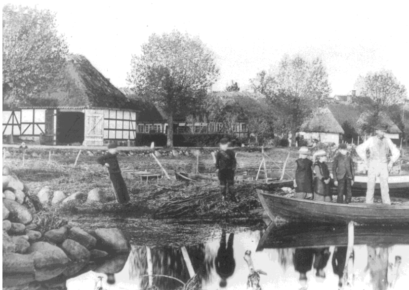
Bådkåse foran Munkebo Kro i 1920'erne