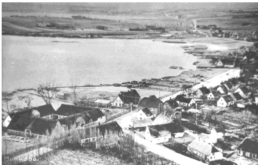
Fjordvejområdet ca. 1950

Øst for kroen ligger ni sammenbyggede huse, hvis historie kan følges tilbage til 1648, hvor det omtales som "Et langt Hus med 9 Vaaninger". Men der har været bebyggelse på lodderne endnu før. Måske er huset i virkeligheden et munkekloster, for langs vandet har der fra ældgammel tid befundet sig et antal bådkåse (bådlejer) til fiskernes pramme. Kåsene forsvandt da den nye amtsvej blev anlagt, men kan være blevet gravet i tidlig middelalder af munkene.