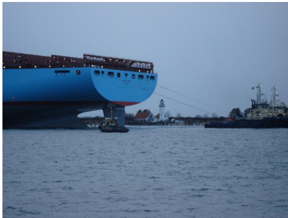
De store nybygninger fra Lindø fyldte godt op i "gabullet", når de blev trukket ud af Odense Fjord, og ofte blev forhalingen fulgt af mange mennesker både ved fyret på Enebærødde og på Midskov-siden.

Men heller ikke på Lindø voksede træerne ind i himlen, selv om der var plads til alle sider og kun få kilometer til Gabet – porten til havet. Der var opture og nedture, store fyringsrunder og i perioder mangel på ordrer. Man var truet af konkurrencedygtige værfter i Østen, og resultatet blev, at bestyrelsen for værftet i