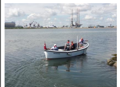
"Kristine" runder pynten