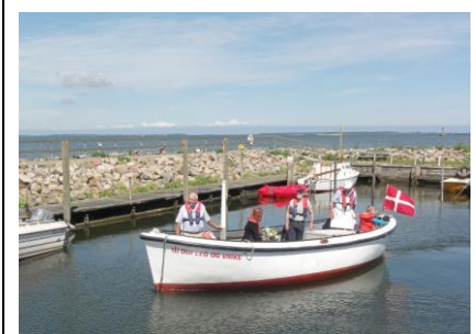
Den stolte skude stævner ud