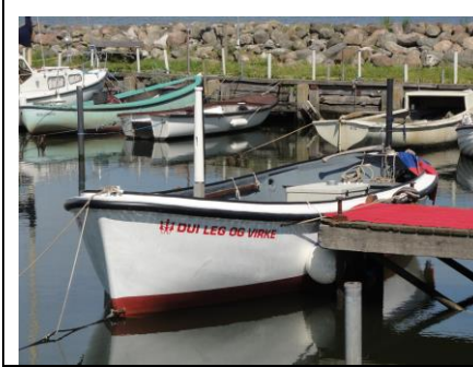
"Kristine" ved kajen