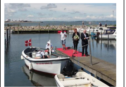
"Hver gang jeg kommer i havn .."