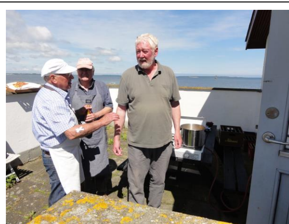
Og skipperlabskovsen var fra Kulturhuset